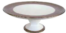
Plat à tarte sur pied Footed cake platter Ø 31,5 cm - 12.4" H : 12,6 cm - 5" Ref. 30120 371 0569