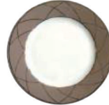
Assiette à gâteaux Salad plate Ø 19 cm - 7.5" Ref. 30120 301 0009