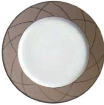
Assiette gastronomie Large dinner plate Ø 28 cm - 11" Ref. 30120 301 0002