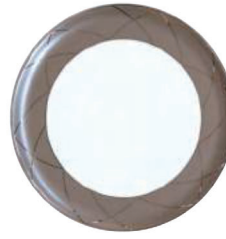
Plat à tarte Tart platter Ø 31,5 cm - 12.4" Ref. 30120 111 0071