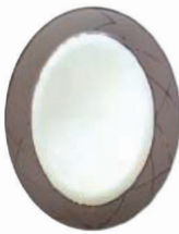
Plat ovale Oval dish L 34,5 cm - 13.6" l : 26,7 cm - 10.5" Ref. 30120 301 0040