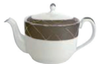
Théière Teapot 105 cl - 35.5 oz Ref. 30120 314 0410