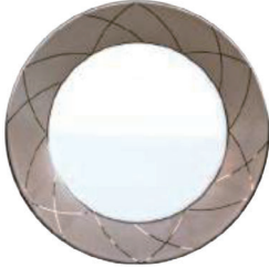
Assiette de présentation Underplate Ø 31 cm - 12.2" Ref. 30120 337 0025