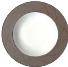
Plat rond creux Deep platter Ø 31,5 cm - 12.4" Ref. 30120 128 0035