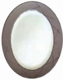
Plat ovale Oval dish L 40 cm - 15.75" l : 31,5 cm - 12.4" Ref. 30120 301 0042