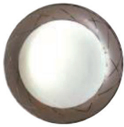
Assiette creuse calotte Rimless soup plate Ø 19 cm - 7.5" Ref. 30120 107 0006