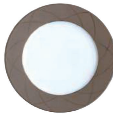
Plat rond plat Flat dish Ø 31,5 cm - 12.4" Ref. 30120 128 0031