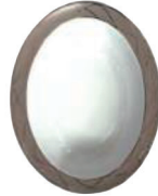
Baker Vegetable dish L : 23,6 cm - 9.3" l : 18,5 cm - 7.2" Ref. 30120 301 0078