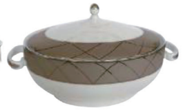
Soupière Soup tureen 250 cl - 84.5 oz Ref. 30120 314 0045