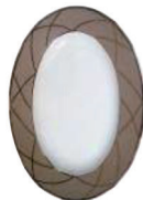
Ravier Pickle dish L 23 cm - 9" l : 16,4 cm - 6.4" Ref. 30120 128 0065