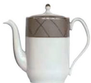
Cafetière Coffeepot 100 cl - 33.8 oz Ref. 30120 314 0400