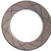
Assiette à dessert Dessert plate Ø 22 cm - 8.7" Ref. 30120 301 0007