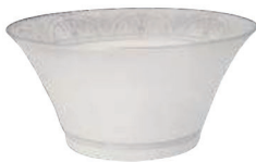
Saladier Salad bowl 200 cl - 67.6" Ø 26 cm - 10.2" Réf. 31370 349 0053