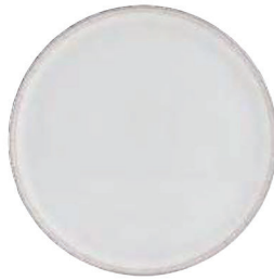
Plat à tarte Tart platter Ø 31,5 cm - 12.4" Réf. 31370 111 0071