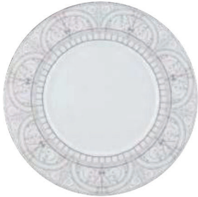
Assiette de présentation Underplate Ø 32 cm - 12.6" Réf. 31370 354 0029