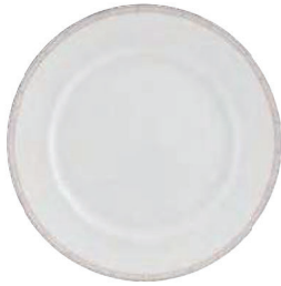
Plat rond plat Flat dish Ø 31,5 cm - 12.4" Réf. 31370 128 0031