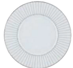
Assiette creuse à aile Rim soup plate Ø 28,5 cm - 11.2" Réf. 31370 354 0130