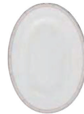
Ravier Pickle dish L : 23 cm - 9" l : 16,4 cm - 6.4" Réf. 31370 128 0065