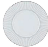
Assiette à dessert Dessert plate Ø 24,5 cm - 9.6" Réf. 31370 354 0007