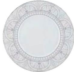
Assiette gastronomie Large dinner plate Ø 29,5 cm - 11.6" Réf. 31370 354 0022