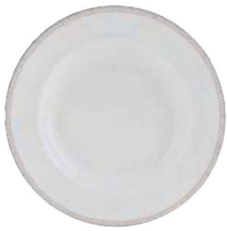
Plat rond creux Deep platter Ø 31,5 cm - 12.4" Réf. 31370 128 0035