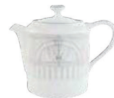
Théière Teapot 55 cl - 18.5 oz H : 13,5 cm - 5.3" Réf. 31370 450 0410