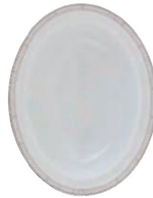
Plat ovale Oval dish 40 cm - 15.7" L : 31,5 - 12.4" Réf. 31370 301 0042